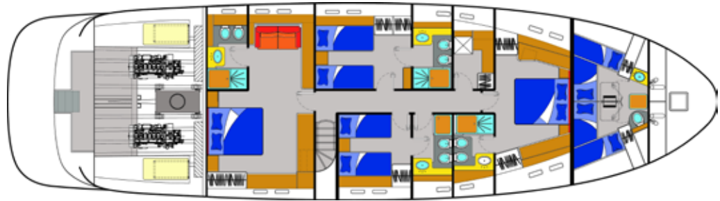
T85 Lowerdeck MEDITERRANEAN CRUISE